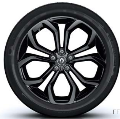
EFFICIENCY WHEEL mit 20-Zoll-Leichtmetallfelge „BLACK Edition“

Exklusive Optik, hochwertige Ausstattung und modernste Technik – so präsentieren sich der Renault Scénic und der Renault Grand Scénic in der außergewöhnlichen BLACK Edition. Markante Designelemente in edlem Schwarz, die Zweifarb-lackierung und schwarze 20-Zoll-Leichtmetall-räder sorgen serienmäßig für bewundernde Blicke. Die exklusiven BLACK Edition Logos auf den Kotflügeln, dem Lenkrad und den Einstiegs-leisten zeigen, dass diese Ausstattungslinie etwas ganz Besonderes ist. Diese Exklusivität spürt man auch im Innenraum. Alcantarapolsterung mit Sei-tenwangen in Lederoptik in Schwarz und mit sil-bernen Ziernähten und ein schwarzer Dachhim-mel sind serienmäßig an Bord. Das gilt auch für die Voll-LED-Scheinwerfer, das Head-up-Display und viele weitere Ausstattungsmerkmale, mit de-nen Sie komfortabel und sicher unterwegs sind.