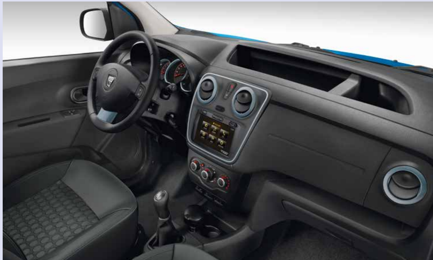
Abb. zeigen Sonderausstattung.

*Nicht alle Bluetooth-Mobilefone sind technisch geeignet. Bitte fragen Sie Ihren Dacia Partner nach den Details.