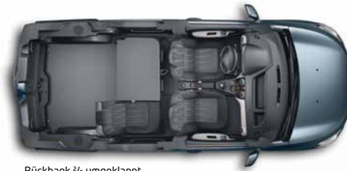
Rückbank \frac{2}{3} umgeklappt