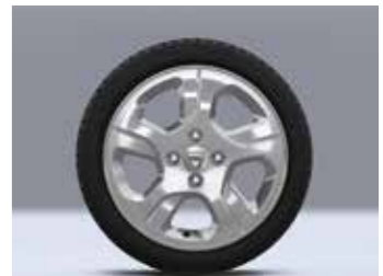
Optionale Leichtmetallräder „Empreinte“, 15 Zoll