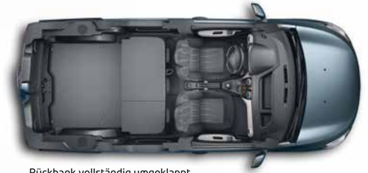
Rückbank vollständig umgeklappt