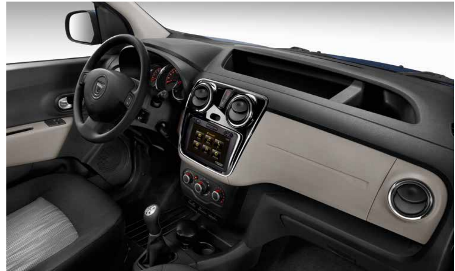
*Nicht in Verbindung mit Motorisierung 1.6 MPI LPG 85.