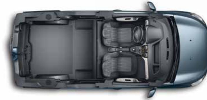
Rückbank gewickelt – für eine ebene Ladefläche