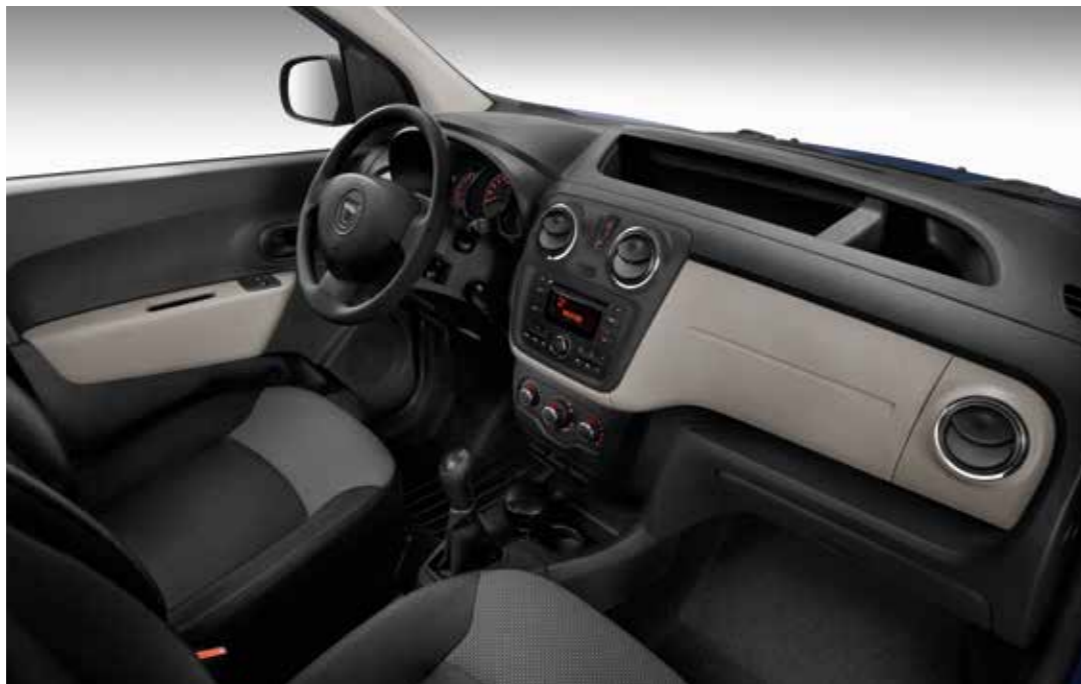
Abb. zeigen Sonderausstattung.