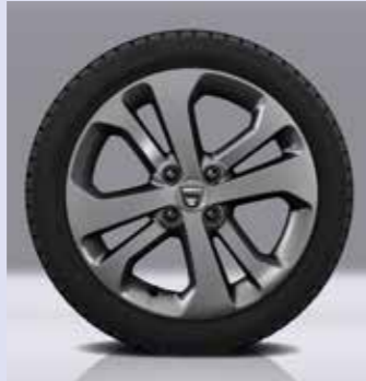
Felge „Panache“, 16 Zoll, in Titan-Optik