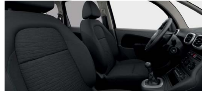
STOFF „LIBERIA“, GRAU, SERIE