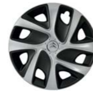
16-ZOLL-STAHLFELGEN MIT RADZIERKAPPEN „AIRFLOW“