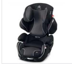
Kindersitz Cruiserfix Pro